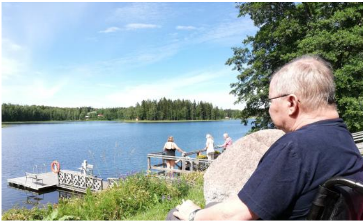
Kesäkuussa seurakunta tarjosi leiripäivän Naarilassa.