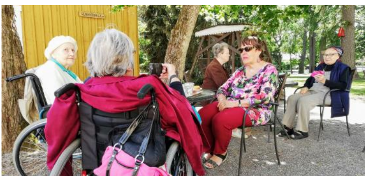
Kesällä kierreltiin kotiseutumatkoilla. Muurlan opistolla poikettiin päiväkahveilla.