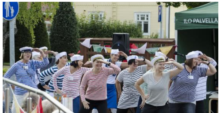
Perinteiset pihafestarit vietettiin elokuussa risteilytunnelmissa.