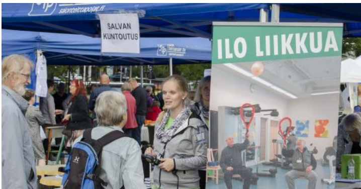
Syyskuun alussa tuttuun tapaan tori täyttyi esittelijöistä ja ihmisistä ja Seniorimessuista.