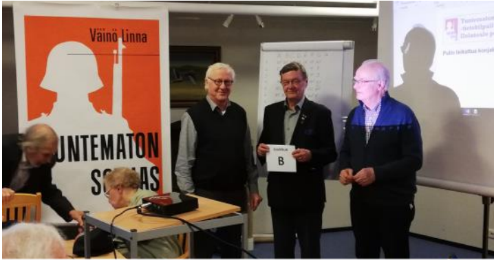
Helmikuussa kisattiin Tuntemattoman sotilaan tietämyksestä.