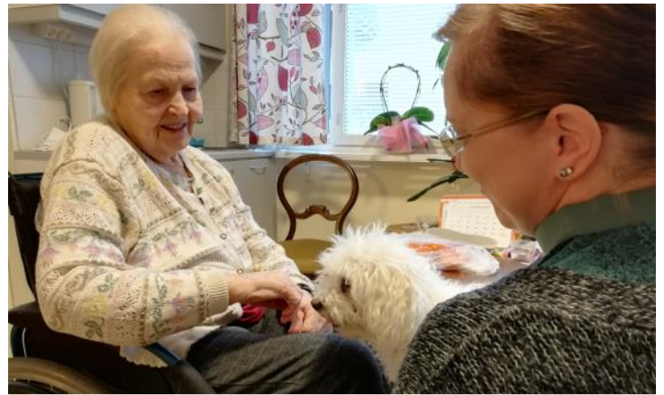
Kaverikoira vieraili palvelukodin puolella tapaamassa asukkaita.